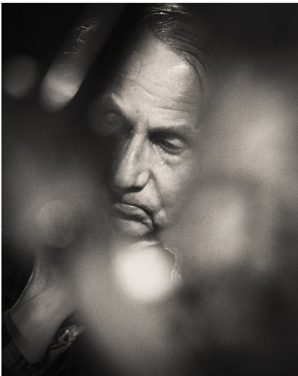
Michel Houellebecq lijkt geen enkele moeite te doen om de grens tussen feit en fictie helder te markeren

Marijn Kruk 15 maart 2023 – verschenen in nr. 11