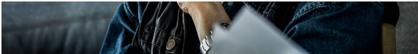
Michel Houellebecq en 2019 en un festival de música en La Rochelle.