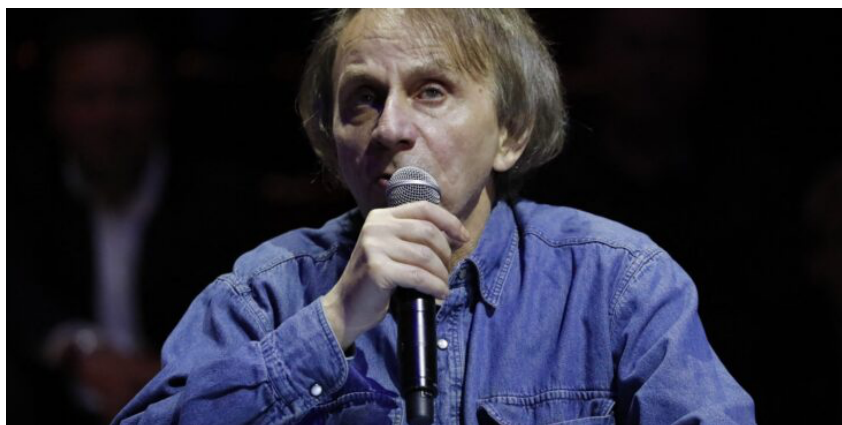
De Franse Schrijver Michel Houellebecq.